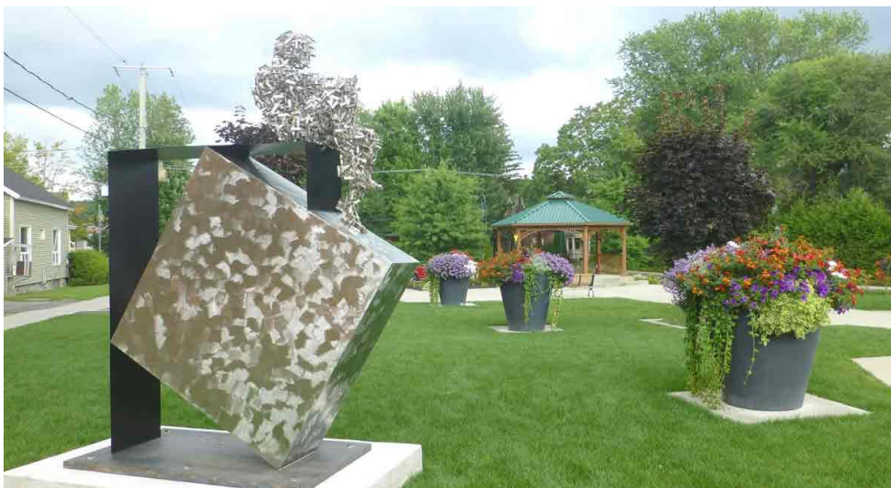
La pieza escultórica en acero inoxidable instalada en la localidad de Granby, en la provincia canadiense de Quebec.

Compartir Joaquín Revuelta | 23/10/2015 AA